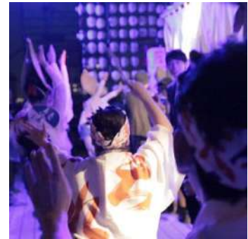
▲お祭りの中を練り歩く踊り子たち

雅楽の演奏後、突如登場した「大阪天水連」のメンバー。華やかさと優美さを併せ持ちながら、キレのある踊りを披露してくれた踊り子達に拍手喝采！クールジャパンをコンセプトとした会場にぴったりの和の演出に、日本人ゲストのみならず海外からのゲストも大興奮！