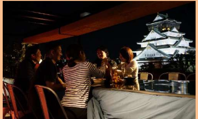
▲写真はイメージです

夏場はBBQで人気を博したルーフトップに期間限定でコタツが登場！コタツに入って天守閣を眺めながら大阪名物てっちりをブイヤベースにアレンジした洋風鍋をお楽しみいただけます。冬の定番コタツ&鍋を、天守閣を眺めながらいつものとは違う感覚でおたのしみください。